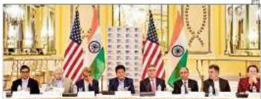
Piyush Goyal interacts with business leaders during a roundtable hosted by the Consul General of India and USISIP in New York City on Friday

New Delhi: India and Canada have launched a trade and investment forum to bring together businesses from both countries to promote commercial management. The government said on Friday after commerce and industry minister Piyush Goyal concluded a three-day visit to the country.